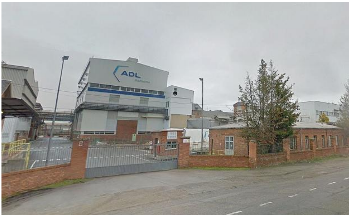
Instalaciones de ADL en León.

ADL Bionatur Solutions cierra su primer ejercicio, el de 2018, con un volumen de facturación superior a los 25 millones de euros, frente a los 13 millones de euros de euros del ejercicio anterior