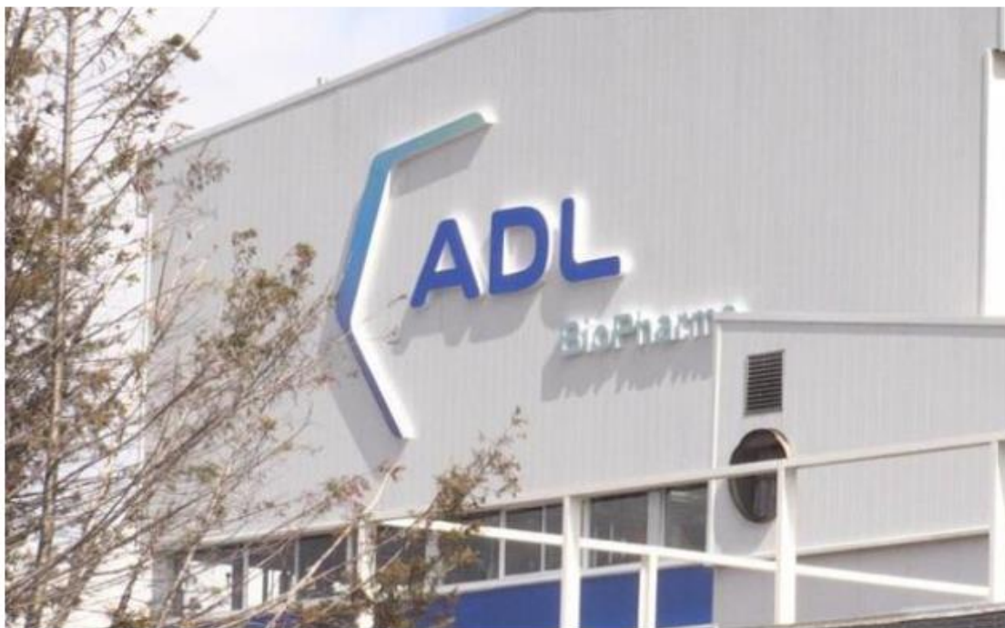
Imagen de la planta de ADL en León.

ADL Bionatur Solutions, antes Antibióticos, culmina en menos de un mes una de las mayores ampliaciones de capital del MAB | La compañía cuenta en su planta de León con 290 empleados