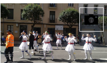
📷 Desfile de trajes regionales por León