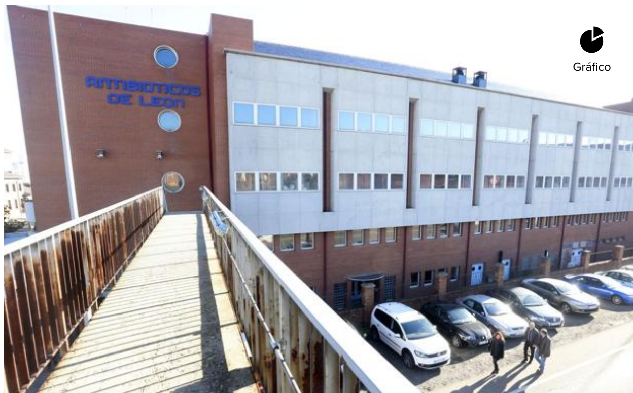
Imagen de la planta de Antibióticos en León.