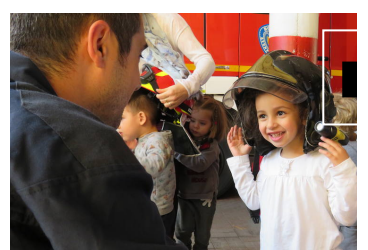
📷 Y de mayor... ¡bombero!