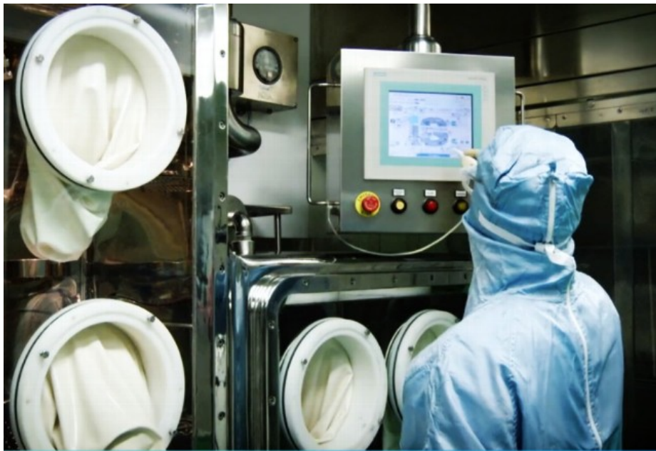
Interior de Adl Biopharma, antes Antibióticos.

La nueva farmaceútica que nacerá de la absorción por parte de la leonesa ADL Biopharma (Antibióticos de León SLU) de la jerezana Bionaturis Group (Biorganic Research Services SA) va quemando etapas para su constitución y ya tiene fechas para finalizar el proceso de integración.