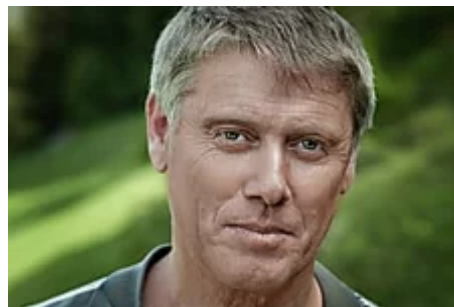
9 de cada 10 adultos españoles necesita curcumina urgentemente... (Cellinnov.es)