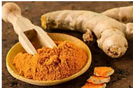
No al ibuprofeno : Curcuma, la alternativa. (cellinnov)