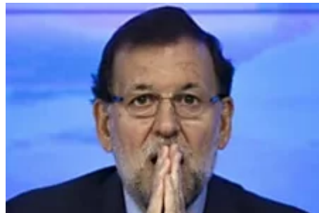
Ni Rajoy ni la UE puede detener la caída económica que se aproxima en España (Inversor Global)