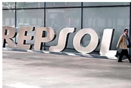
China fuerza a Vietnam a suspender una inversión de Repsol