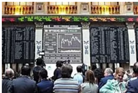
Las acciones que más alegría darán a los inversores en bolsa. (Estrategias de inversión)