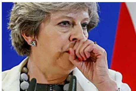
Londres empieza a asumir la "dura realidad" que le espera fuera de la UE