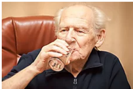
Próstata : evite este error cometido por millones de hombres (Cellinnov.es)