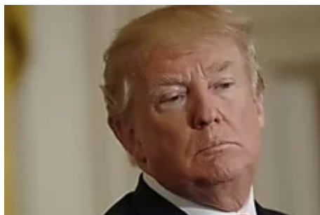
Qué valores españoles se la juegan en el engranaje arancelario de Trump