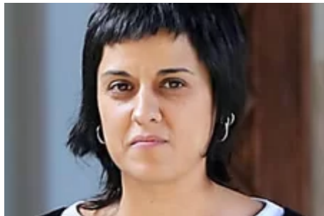
Lo que los medios no dicen sobre Anna Gabriel (Éxcite)